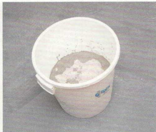
2. Anyag pihentetése 3–5 percig