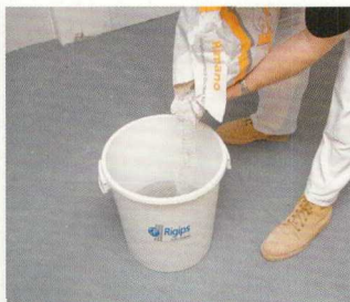
1. Az anyag lassú szórása

Ezzel az eljárással optimális sűrűségű anyagot kapunk, amely nem folyik le a felületről és csomómentes.