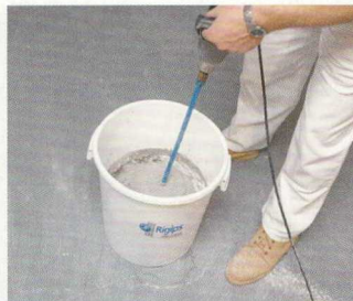
3. Anyag keverése kézi keverővel