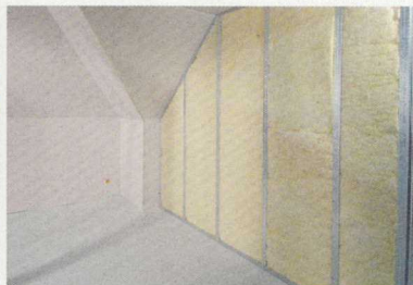
Az ásványgyapot szigetelés behelyezése