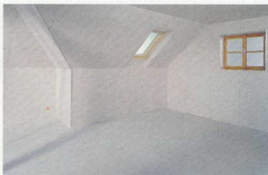
Tér a válaszfalak megépítése előtt

A tetőtéri válaszfalakat vagy megépítjük a vízszintes és ferde borítások elkészítése előtt, vagy először a vízszintes és ferde felületek burkolatát készítjük el. Dilatációs és főképp akusztikus szempontok miatt előnyösebb az a megoldás, hogy előbb építjük meg a válaszfalakat, s ezt követően szereljük fel a ferde, vízszintes és függőleges tetőtéri borítást. Amennyiben a válaszfalat a már teljesen gipszkartonozott tetőtérben építjük meg, úgy a válaszfal körítő UW- és CW-profiljait 212. típusú csavarokkal, a burkolólapokon keresztül, a CD-profilokból vagy falécekből készült alapszerkezetbe rögzítjük. Esetenként a határoló UW- és CW-profilokat a lapokba is rögzíthetjük, Molly dübelek segítségével. Ezáltal megszakad a hanghíd a ferde sík borításánál. A tetőtéri válaszfalak csatlakoztatásának részleteit és alapelveit lásd 219. oldal VI.6 fejezet. Az általános tudnivalókat és a szerelésükkel kapcsolatos alapelveket a III. fejezet tartalmazza.