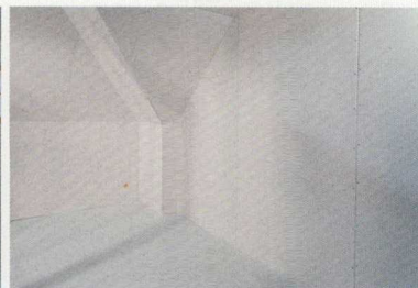
A fal másik oldalának burkolása